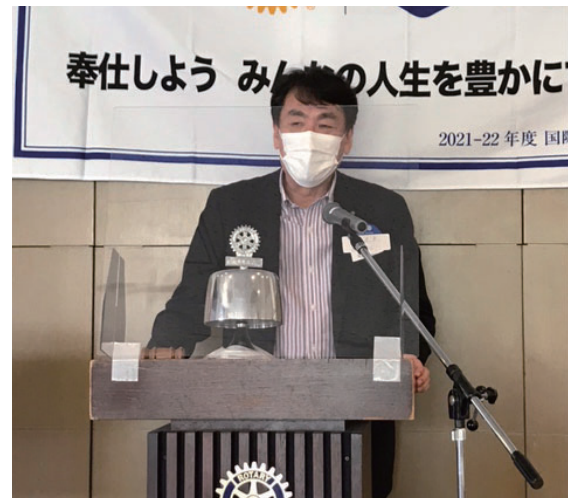
ガバナー補佐幹事 嘉規 洋様